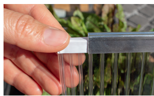
3. HKP BEREIT ZUM EINSATZ