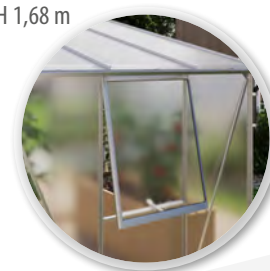
FENÊTRE LATÉRALE INCLUSE