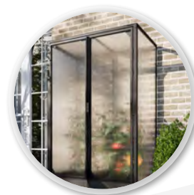
ACCESSOIRES EN OPTION : PORTES BATTANTES