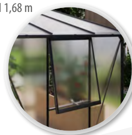
FENÊTRE LATÉRALE INCLUSE